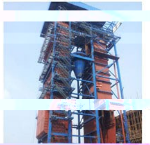
150吨流化床电站锅炉安装现场照片